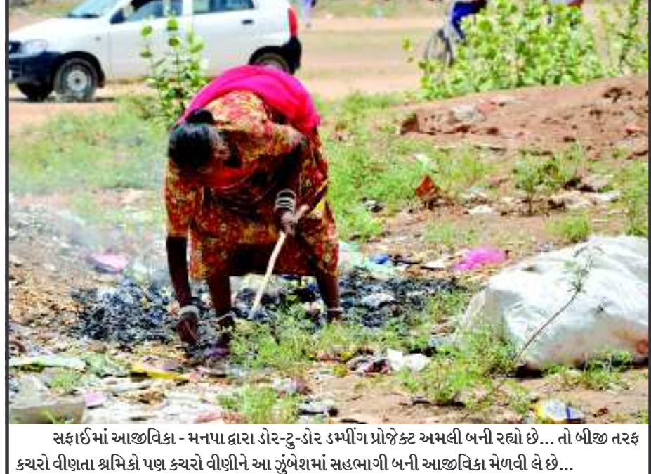
સફાઈમાં આજીવિકા - મનપા દ્વારા ડોર-ટુ-ડોર ડમ્પીંગ પ્રોજેક્ટ અમલી બની રહ્યો છે... તો બીજી તરફ કચરો વીણતા શ્રમિકો પણ કચરો વીણીને આ ઝુંબેશમાં સહભાગી બની આજીવિકા મેળવી લે છે...

તબક્કાવાર એક માસમાં સમગ્ર શહેરને આ પ્રોજેક્ટ હેઠળ આવરી લેવાશે : સ્થાયી સમિતિએ બેઠકમાં પ્રોજેક્ટના કામો ઝડપથી પૂર્ણ થાય તે જોવા તાકીદ કરી