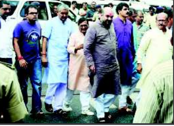
કર્યો હતો. હવાઈ મથકથી તેમના શ્વેતજે ખાતેના ભવ્ય નિવાસ સ્થાન સુધી રોડ-શો કરતા પહોંચ્યા હતા જ્યાં તેમના કુટુંબીજનો ઉપરાંત

અમદાવાદ, તા. ૧૧ ભારતીય જનતા પાર્ટીના રાષ્ટ્રીય પ્રમુખ બન્યા બાદ આજે પ્રથમવાર અમદાવાદ આવી પહોંચેલા અમિત શાહનું અમદાવાદ ડેપો કોન આયા ગુજરાત કા શેર આયા જેવા ગગન ભેદી સુત્રોચ્ચાર સાથે પુષ્પગુચ્છ તથા પુષ્પ વૃષ્ટિથી શાનદાર સ્વાગત કરવામાં આવ્યું હતું. આ પ્રસંગે હવાઈ મથક નજીક તૈયાર કરાયેલા એક સ્ટેજ પરથી અમિત શાહે તેમના સન્માનનો પ્રત્યુત્તર આપ્યો હતો અને ભાજપના સંગઠને તેમની ઉપર જે વિશ્વાસ મુક્યો છે તે એળે નહીં જવા દઉં તેવી ખાતરી ઉચ્ચારી હતી અને તેમના કપરા સમયમાં પણ પક્ષનું સંગઠન પણ તેમની પડખે અડીખમ થઈને ઉભું રહ્યું હતું તે બદલ