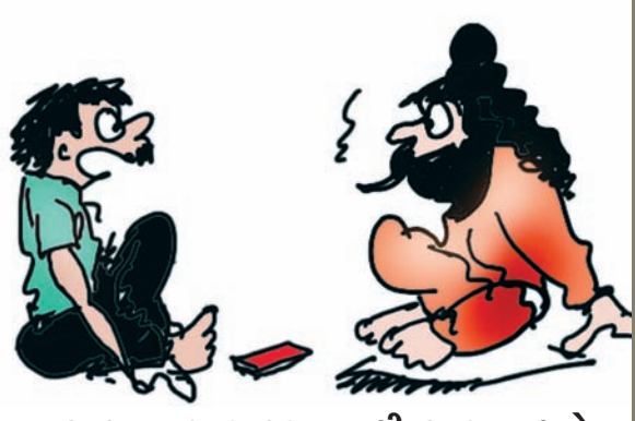
ગુરુજી... ફાસ્ટ ફુડ ખાવાથી ફાસ્ટ ન થયો... સ્માર્ટ ફોન રાખવાથી સ્માર્ટ પણ ન થયો... પણ લુગ્મોશન થવાથી લુગ્મ થઈ ગયો... એવું કેમ...??