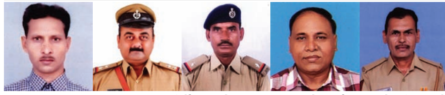
ગાંધીનગર, તા. ૨૫ મહાનિર્દેશકની કચેરી હોમગાર્ડ્સ દળના બે અધિકારીઓ

જિલ્લાના બે હોમગાર્ડ અધિકારીઓને પ્રશંસનીય સેવા બદલ મુખ્યમંત્રીના બે ચંદ્રક