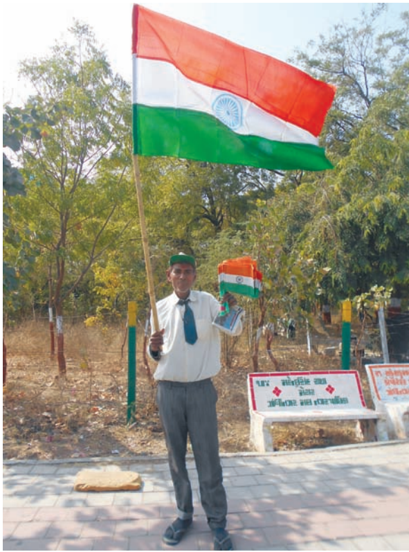
ત્રિરંગા પ્યારા - પ્રજાસત્તાક દિનની પૂર્વ સંધ્યાએ શહેરના રાજમાર્ગો ત્રિરંગાથી છવાયા હતા... ઠેર ઠેર ત્રિરંગાને લઈને ઉભેલા નાના વિકેતાઓ નજરે પડતા હતા...

અને સેક્ટરોની શેરીઓમાં પણ સપાટો જોવા મળે છે. પરંતુ છેલ્લા બે દિવસથી બદલાતા મોસમના મિજાજના લીધે નગરનું જનજીવન પણ પ્રભાવિત થયું છે. થોડા સમય અગાઉ આક્રમક ઠંડીના લીધે નગરજનો ગરમ કપડામાં લપેટાયેલા જોવા મળતા હતા. જ્યારે છેલ્લા બે દિવસથી ઠંડીની ઋતુમાં ગરમીનું પ્રભુત્વ જોવા મળે છે. લઘુત્તમ તાપમાનનો પારો સતત ઉંચો આવતો જાય છે. જેના પરિણામે ઠંડીનું પ્રમાણ ૧૫ થી ૧૬ ડી ગ્રી સુધી પહોંચી જતા વાતાવરણમાં ગરમીનો અહેસાસ થઈ રહ્યો છે. જ્યારે બીજાતરફ દિવસ દરમિયાન મહત્તમ તાપમાન પણ આજે ૩૩ ડી ગ્રી રહ્યું હતું. ગઈકાલે પણ મહત્તમ તાપમાન ૩૪.૫ ડી ગ્રી નોંધાયું હતું દિવસનું તાપમાન ઉંચ બનતા નગરજનો દિવસ દરમિયાન આકરા તાપ વચ્ચે ઉનાળા જેવી ગરમીનો અહેસાસ કરી રહ્યા છે.