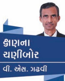
કાણના ચાણીબોર ડૉ. જય અાન્ડ

કરવાની વૃત્તિ પણ ગાંધીમાં પ્રબળ હતી. ૧૯૩૮ નો હરિપુરા કોંગ્રેસનું અધિવેશન થયું ત્યારનો એક પ્રસંગ શ્રી અમૃતલાલ વેગડે આલેખ્યો છે. બાપુને શાંતિનિકેતનવાળા પ્રસિધ્ધ ચિત્રકાર નંદલાલ બસુ પ્રિય હતા. બાપુ નંદલાલને સર્જનાત્મક કલાકાર ગણાવતા હતા. હરિપુરા આવવા માટે બાપુએ નંદલાલને આગ્રહ કર્યો. નંદલાલ સ્વસ્થ ન હતા છતાં ગાંધીજીના આગ્રહને કારણે આવ્યા. બાપુ તેમને આગ્રહ કરીને તિથલ (વલસાડ) લઈ ગયા. તિથલના દરિયાકાંઠે નંદલાલ તેમના ચંપલ ઉતારીને ભીની તથા સુંવાળી રેતીના સ્પર્શની અનુભૂતિ કરતા દૂર સુધી ફરવા જતા રહ્યા. નંદલાલ પાછા આવીને ચંપલને શોધે છે. તે સમયે તેઓ જુએ છે તો બાપુ તેમના ચંપલની જાગૃત ચોકીદારી કરતા ખડા છે! નંદલાલને પાછા આવેલા જોઈ બાપુએ એજ મુક્તહાસ્ય કરીને કહ્યું : “હું જાણતો હતો કે આ તારાં ચંપલ છે. હું એમ ઈચ્છતો નહોતો કે કોઈ કૂતરું આવીને તારાં એક ચંપલ લઈ જાય અને બીજું ચંપલ નિસાસા નાખવું પડ્યું રહે!” બાપુની વાત સાંભળી નંદલાલ તાજૂબ થઈ ગયા તથા આ ઘટના પછી કેટલાયે દિવસ ચંપલ પહેરી ન શક્યા. હરિપુરા અધિવેશનમાં પણ બાપુએ નંદલાલને પોતાની કુટીર પાસેજ ઉતારો અપાવ્યો. બાપુના દર્શન કરવા આદિવાસી મહીલાઓનું એક ટોળું બાપુની કુટીરમાં આવ્યું. ગાંધીજીને વિનોદ સૂઝ્યો. એમણે મળવા આવેલી બહેનોને કહ્યું : “જુઓ, સામે પેલી ઝૂંપડીમાં બંગાળના એક મોટા મહાત્મા ઉતરેલા છે. એમના દર્શન કરતા જજો.” મહીલાઓ આશીર્વાદ લેવા માટે નંદલાલ બસુના ઉતારે ટોળે વળી. નંદલાલની મુંઝવણનો પાર નહિ. તેઓ કંઈ સમજી પણ ન શક્યા. પાછળથી ગાંધીજીએ હસતા હસતા રહસ્યસ્ફોટ કર્યું ત્યારે બાપુડા નંદલાલને બાપુના આ કાવતરાની જાણ થઈ. જીવનની રસિકતા તેમજ પવિત્રતા બંનેને સમાંતરે ટકાવી રાખે તેવા બાપુ સર્વગુણ સંપન્ન હતા. શાયર શોખાદ મ આબુવાલાએ આ