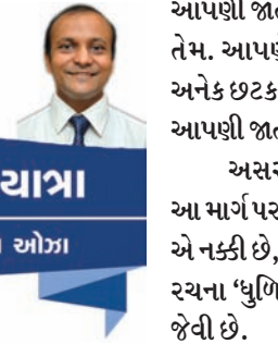
વિચારયાત્રા ડૉ. જય અાન્ડ

હમદર્દ સાબિત થાય છે, જ્યારે સગા-સંબંધીના આશ્વાસનમાં પણ આપણને કટાક્ષનો અનુભવ થાય છે. કારણ કે 'બધા સગા વડાલા હોતા નથી, અને બધા વડાલા સગા હોતા નથી.' સંબંધો બાંધવા, તેને જાળવવા એ એક કળા છે, સંબંધ આરસી જેવા હોય છે. આ આરસીમાં આ દર્પણમાં આપણે જોઈ શકીએ છીએ આપણી જાતને. આપણે જેવા છીએ તેવું જ દર્શન તેમાં થાય છે. જેમ છે તેમ. આપણે જેવા છીએ તેમાંથી છટકી શકવાના નથી, છતાં આપણે અનેક છટકબારીઓ શોધવાનો પ્રયત્ન કરીએ છીએ, છટકીને જશું ક્યાં? આપણી જાતથી છટકી છટકીને કેટલે જઈ શકવાના? અસરપરસ હળીમળીને વ્યક્તિ-વ્યક્તિ વચ્ચે તાદાત્મ્ય સાધીને આ માર્ગ પર પગરણ માંડશું તો આ માર્ગે હજારો દીપથી જગમગી ઊઠવાનો એ નક્કી છે, વાર છે ફક્ત આપણા કડમ ઉઠાવવાની. મકરંદ દવેની અમર રચના 'ધુળિયો મારગ' ની પંક્તિઓ વાંચીને સમજીને જીવનમાં ઉતારવા જેવી છે. ધૂળિયે મારગ કૈંક મળે જો આપણા જેવો સાચ, સુખ દુઃખની વારતા કેતા બાથમાં ભીડી બાથ, માનવી ભાળી અમથું અમથું આપણું ફોરે વડાલ, નોટ કે સિક્કા નાખ નહીંમં, ધૂળિયે મારગ ચાલ! - jaypuoz@gmail.com, Mo. 9898046488