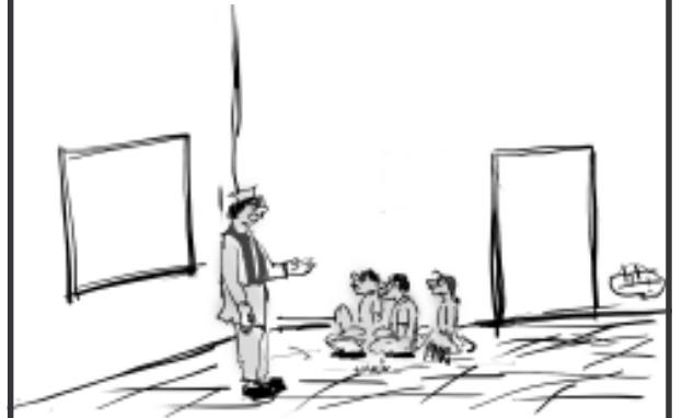
હું આજના શિક્ષક દીન નિમિત્તે એટલું જ કહીશ... શિક્ષક તરીકેની કેરીયર ચાલુ કરી ત્યારે જેવો હતો તેવો જ હું અને મારા વિદ્યાર્થીઓ કયાંના કયાં પહોંચી ગયા છે !!