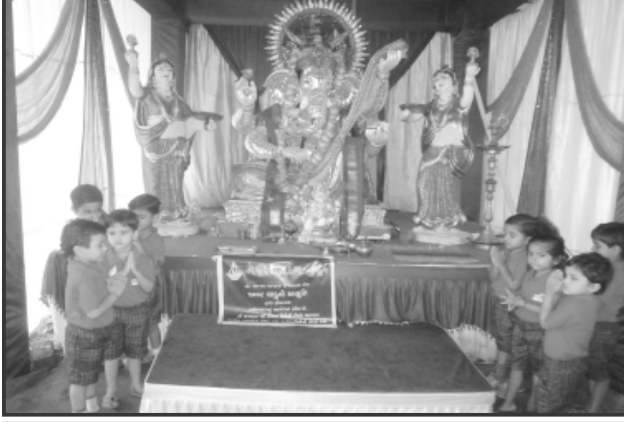
ભુવનેશ્વર મહાદેવ ખાતે સ્થાપિત ગણેશ ભગવાનનાં દર્શનાર્થે રંગોલી ચિલ્ડ્રન સ્કુલના નાના બાળકોને લાવવામાં આવ્યા હતા. ‘ગણપતિ બાપ્પા મોટીયા’ થી આ નાના ભૂલકાંઓએ વાતાવરણને ગરબી મુક્યું હતું. અત્યારથી જ આદ્યાત્મિકતાનાં પાઠ શિખવાડવામાં આવે તે ખરેખર પ્રશંસનીય છે.