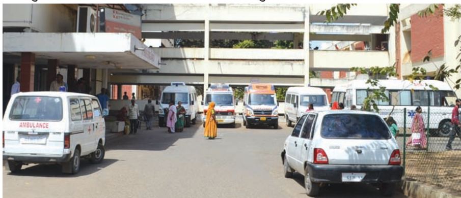
માંગ દર્દીઓ કરી રહ્યા છે. ગુજરાત મેડીકલ એજ્યુકેશન સોસાયટી સંચાલિત હોસ્પિટલમાં

છે. પરંતુ દર્દીઓને મળતી સુવિધામાં ક્યાક કર્મચારીઓને પગલે ક્યાશ જોવા મળી રહી છે. સંકુલના તાત્કાલીક વિભાગમાં જે દર્દી આવે તે ચાલી કે ઉભો થઈ શકવાની ક્ષમતા ધરાવતો હોતો નથી. એટલે તેને હોસ્પિટલમાં લાવવાની ફરજ પડે છે ત્યારે હોસ્પિટલના તાત્કાલીક વિભાગમાં સ્ટ્રેચર કે વ્હીલચેર ન હોવાથી દર્દીઓને સગાઓએ ઉંચકીને જતુ પડે છે. તેમજ અન્ય વોર્ડમાંથી વ્હીલચેર લાવીને લઈ જવા પડે છે ત્યાં સુધી દર્દીઓને હેરાન થવાનો વારો આવે છે ત્યારે તાત્કાલીક વિભાગમાં સત્વરે વ્હીલચેર અને સ્ટ્રેચરની અછત દુર થાય તેમ દર્દીઓ ઈચ્છી રહ્યા છે.