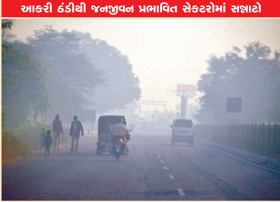
ગરમીનો અહેસાસ કરી રહ્યા છે. ળેલી સવારે વાતાવરણમાં

ઠંડીએ તીખા તેવર દેખાડતા સવારે મોર્નિંગ વોક કરનારઓની સંખ્યામાં પણ ઘટાડો જોવા મળી રહ્યો છે. શહેરમાં ઠંડીનું પ્રમાણ વધતા સવારે સ્કૂલે જતા વિદ્યાર્થીઓ પણ ઠંડીમાં ઠુંઢવાઈ રહ્યા છે. કોલેવેવાના લીધે શ્રમિકોની હાલત દયાજનક બની રહી છે. ઠંડીનું પ્રમાણ એકાએક વધતા જનઆરોગ્ય પર વિપરિત અસર વર્તાઈ રહી છે. ઠંડીના મોજાના લીધે રાત્રિના સમયે શહેરમાં સન્નાટો છવાયેલો જોવા મળે છે. જ્યારે કોલેવે વચ્ચે શહેરમાં લગ્નસરાની સિઝન નિખરી છે.